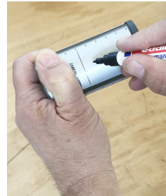
Marcar o tipo de óleo e a data de início de operação