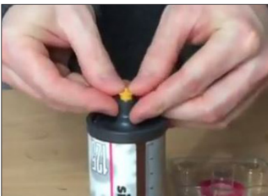
Colocar a válvula anti-retorno amarela