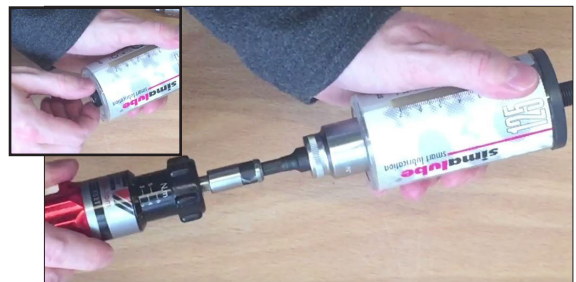
Parafusar o gerador de gás e apertar com 1,5-2,0 Nm