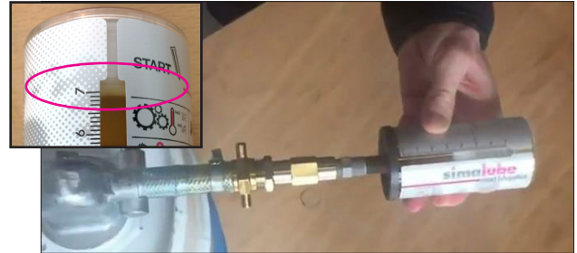
Encaixar o simalube no bico e encher com óleo. ⚠ Não encher acima da marca!