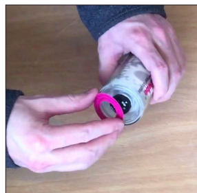
Colocar o anel magenta